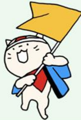
禁煙サポーター 登録による禁煙成功率

家族や同僚など身近な人に サポーターになってもらい、 一緒に禁煙を目指す取り組みです